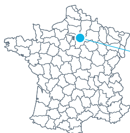
Paris 8 Paris