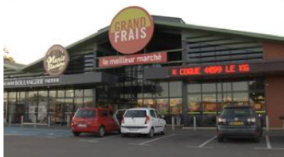
Grand Frais - Avignon

La SCPI s'est également rendue propriétaire des murs de «Grand Frais Avignon» le 29 juin 2012, représentant une surface utile de 1 773 m 2 . Le taux de rendement brut effectif s'élève à 7%. L'enseigne Grand Frais créé en 1998 connaît un développement