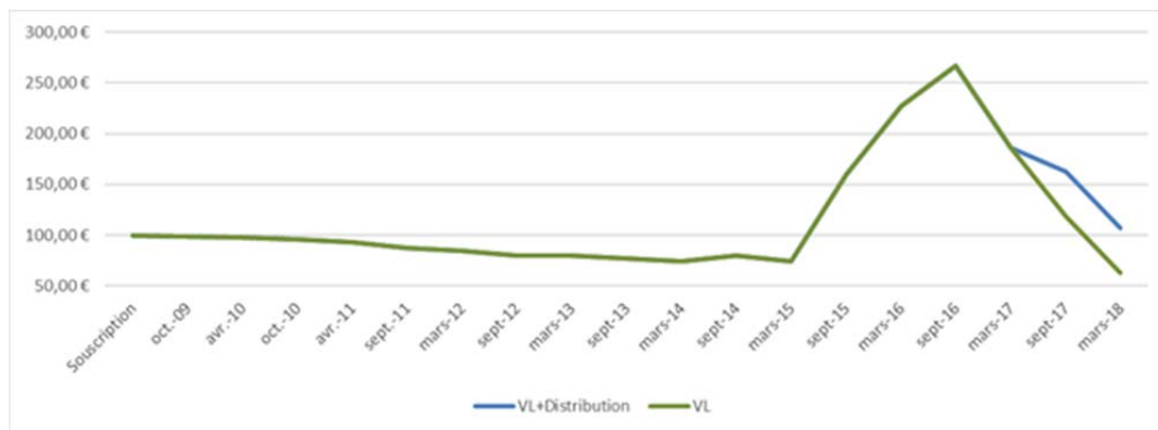
Les performances passées ne présagent en rien les performances futures.