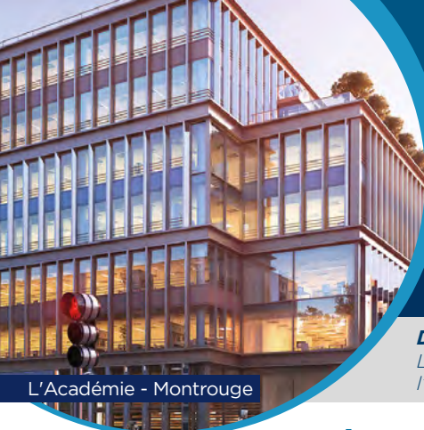
L'Académie - Montrouge