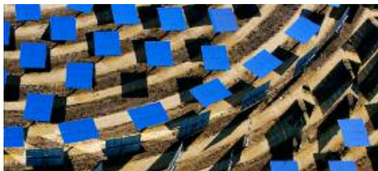
Centrale solaire thermoélectrique de Sanlúcar la Mayor, près de Séville, Andalousie, Espagne (37°26'N - 6°15'O).