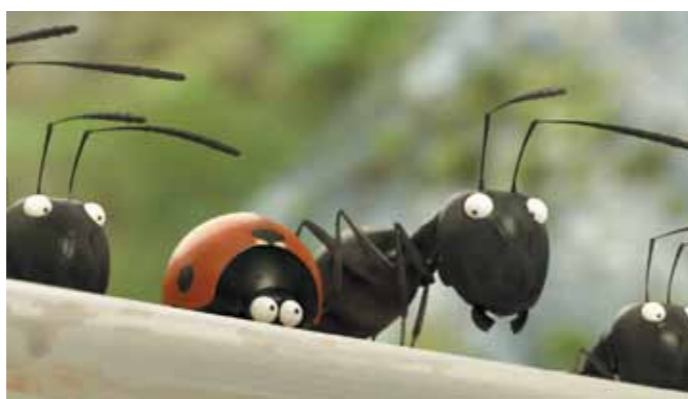
Ces illustrations concernent des investissements déjà réalisés par les SOFICA fondées par Backup Media. B MEDIA 2012 n'investira pas dans ces films.