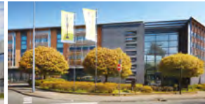
2018, Villeneuve d'Ascq (59), loué par EDF.

Les investissements passés ne préjugent pas des investissements futurs.