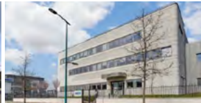
2021, Gennevilliers (92), siège social d'Audika.