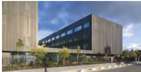
2022, Toulouse (31), siège régional de RTE.